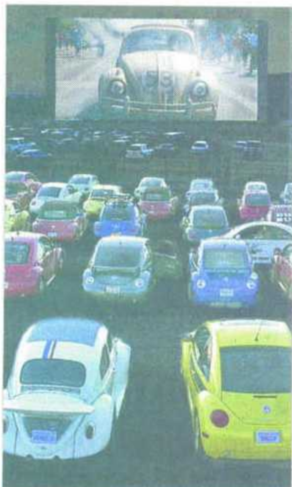
Mit dem Auto ins Kino: Möglich am 10. September an der Tanne.

Die Organisatoren verbindet ein nach eigenen Angaben gutes Verhältnis. Man arbeite auch im Tagesgeschäft eng zusammen. (SZ/ass)